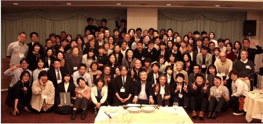
第 17 回学術会議 懇親会後の集合写真